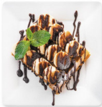
Бельгийская вафля «Банан и Нутелла»