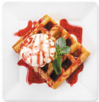
Бельгийская вафля «Мороженое и клубника»