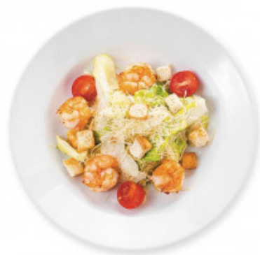
Салат "Цезарь с креветками"