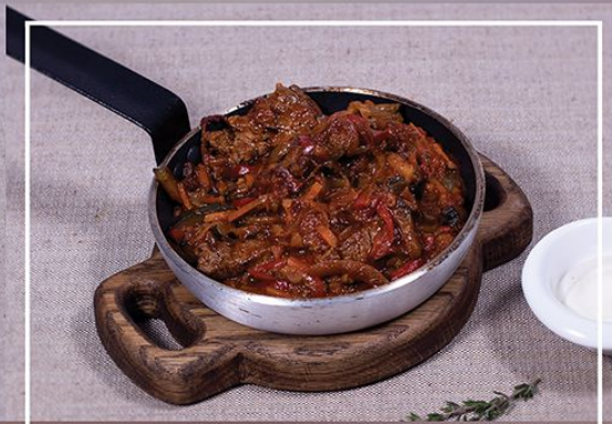
Шипящая сковорода с мясом и овощами 280/40 с говядиной 590.00 со свиной 520.00 с курицей 470.00