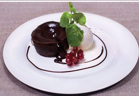
Шоколадный фондан 100/59