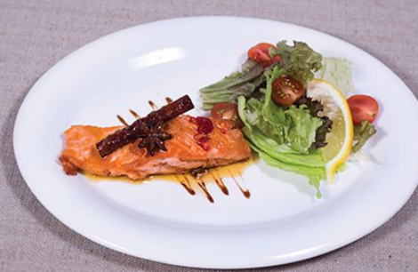
Семга под медовым соусом 830.00 (стейк из семги под фирменным соусом «Мед»; подается с Микс-салатом и томатами Черри) 160/95/20