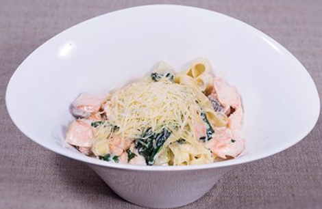
Феттучини с семгой и шпинатом 310 г. 590.00