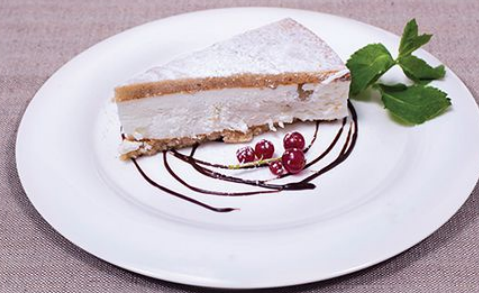
Грушевая рикотта 90 г.