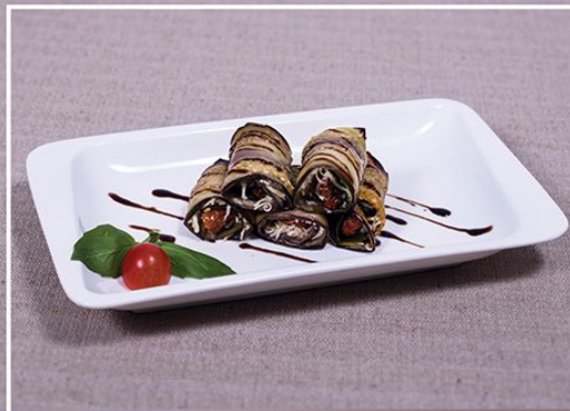
Рулетики из баклажанов (рулетики из баклажанов с начинкой из сыра и вяленых томатов)