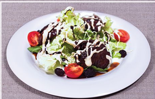
Салат с куриной печенью и овощами 410.00 (обжаренная куриная печень и салатный микс подается под сливочным соусом) 260 г.