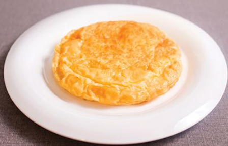
Омлет 150 г.