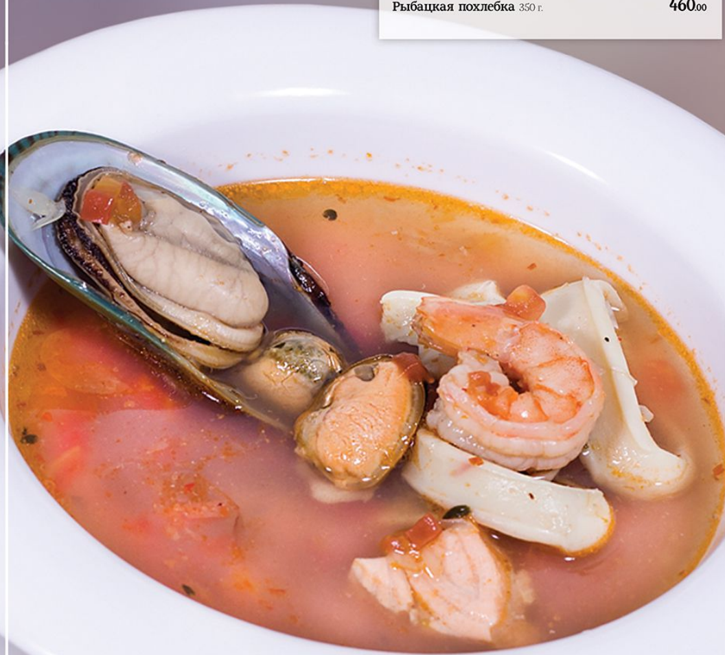
Рыбачья похлебка 350 г. 460.00