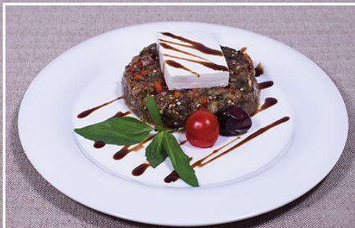
Салат «Баклажан» 310.00 (запеченный на гриле баклажан, болгарский перец, базилик свежий, крымский лук, бальзамический уксус, масло оливковое, сыр «Фета») 360 г.