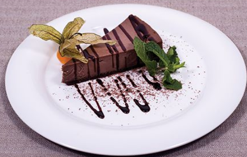
Чизкейк шоколадный 100/20