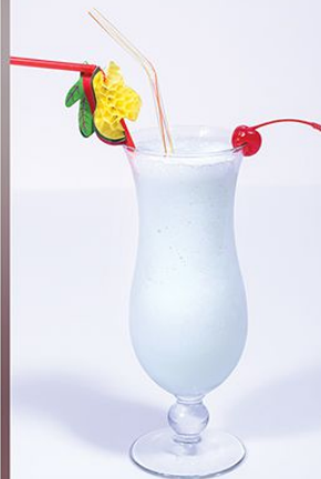
Коктейль Медовый 240.00 (сироп, варенье, мед, молоко, мороженое) 1/400