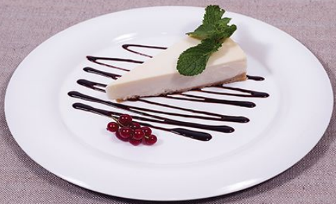
Чизкейк классический 100/20