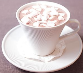
Какао 150 г.