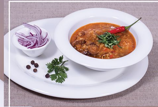
Острый суп-харчо с бараниной 350 г. 300.00