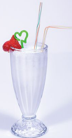
Коктейль молочный 180.00 (сироп, молоко, мороженое) 1/300