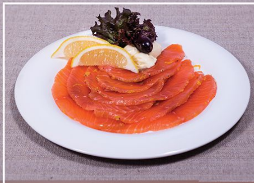
Слабосоленая семга домашнего посола (подается со сливочным маслом и лимоном)