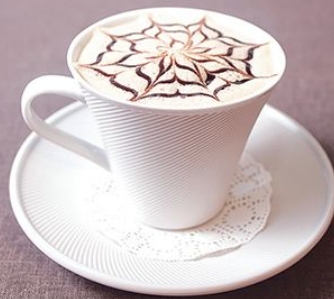
Раф-кофе 150 г.

- бекон 80.00 - сыр 80.00 - помидоры 50.00 - зелень 50.00