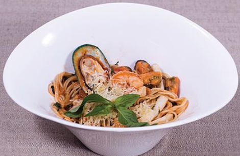
Спагетти с морепродуктами 415 г. 620.00