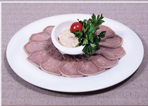
Говяжий язык с хреном (язык говяжий отварной, хрен)