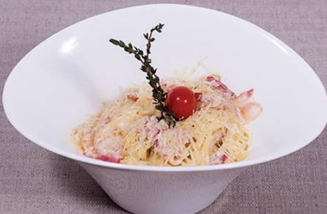
Паста «Карбонара» 290 г. 450.00