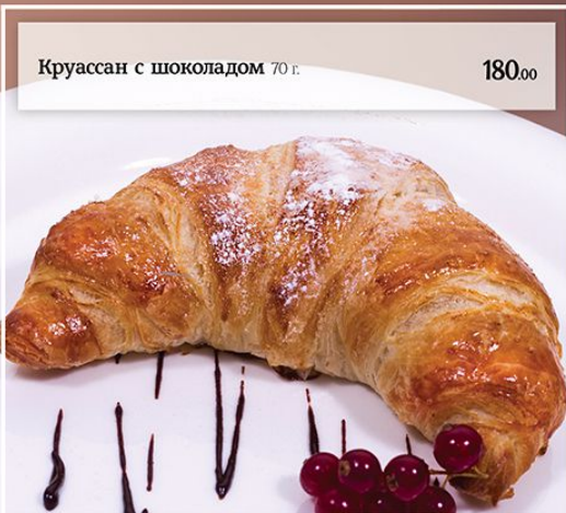
Круассан с шоколадом 70 г.