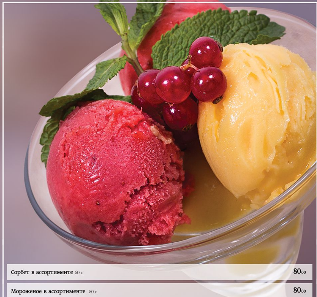
Сорбет в ассортименте 50 г.