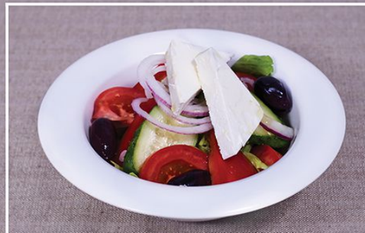
Салат «Греческий» 340.00 (салат айсберг, огурцы, томаты, перец болгарский, крымский лук, сыр Фета, оливки) 225 г.