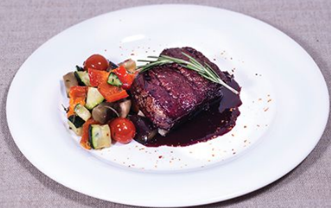
Филе «Миньон» в винном соусе (подается с припущенными овощами)