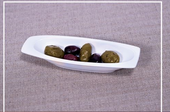
Оливки 50 г.