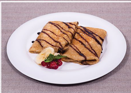
Блинчики с бананом 170 г.