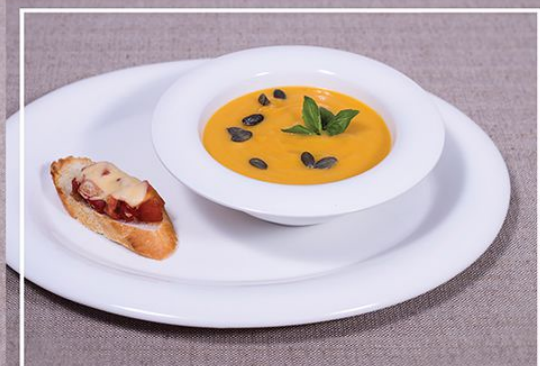
Тыквенный суп 300 г. 210.00