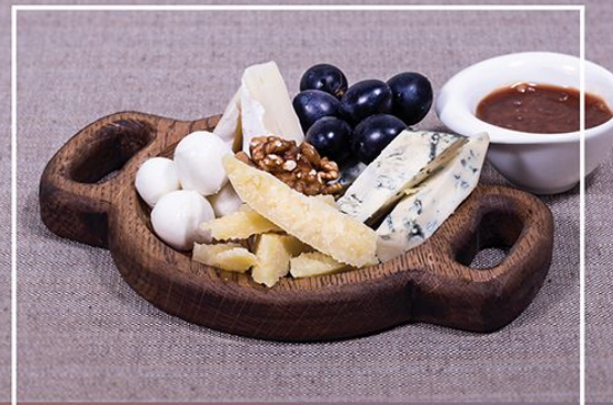
Сырная тарелка (моцарелла, Дор-Блю, Камамбер, Пармезан, мед, орехи, виноград) 120/60/20