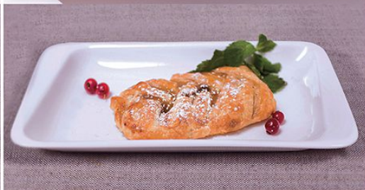
Кленовый пекан 90 г.