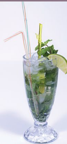
Мохито классический 200.00 (мята, сахар тростниковый, сироп, Спрайт, Швепс, лайм) 1/300