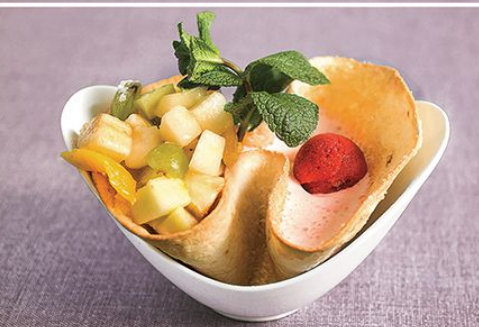
Фруктовый салат 230 г.