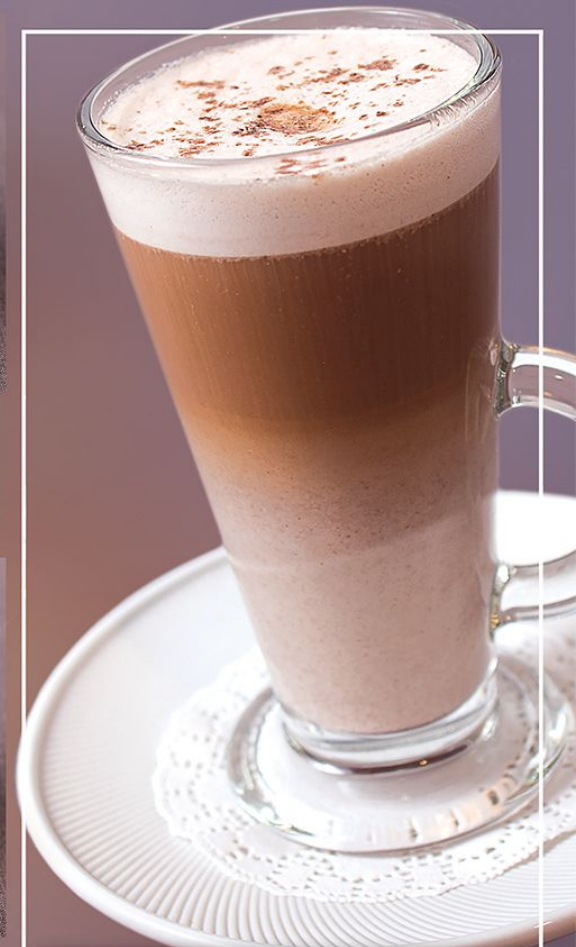
Латте с халвой 200 г.