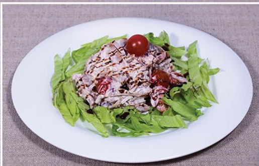
Салат «Мясной Микс» 450.00 (буженина, бекон, говяжий язык, грибы, томаты черри, крымский лук под домашним майонезом) 205 г.