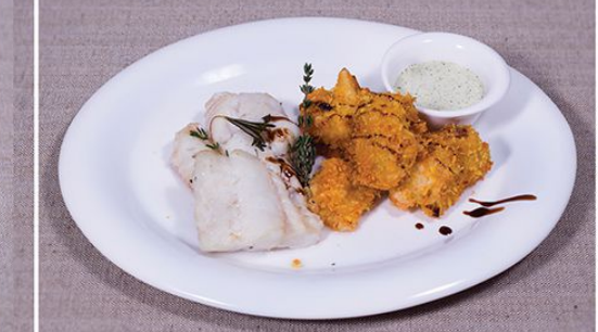
Треска, припущенная в вине 490.00 (филе трески, припущенное в белом вине; подается с цветной капустой в коруе из ароматных трав) 160/100/20