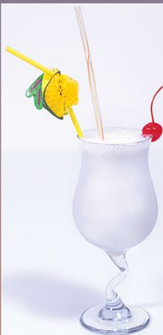
Банановый мусс 200.00 (банан, сироп, молоко, мороженое, шок крошка) 1/300