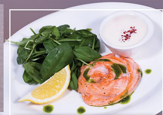
Морская роза под икорным соусом 890.00 (филе семги на подушке из сливочно-икорного соуса подается со свежим шпинатом) 120/80/45