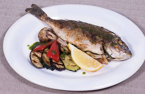
Дорадо на гриле 790.00 (подаётся с овощами-гриль) 1/100/80