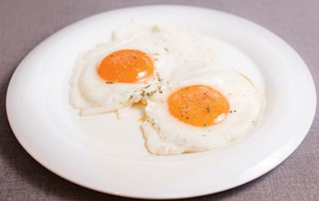
Яичница 80 г.