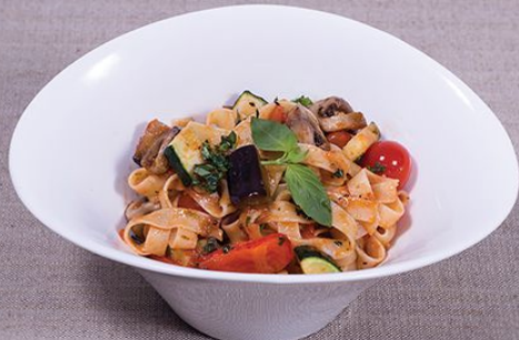
Паста с овощами 285 г. 420.00