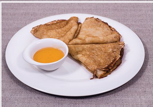
Блины 120 г.