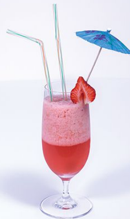
Лонгдринк Клубничный 300.00 (клубника, лайм, Спрайт, сахар тростниковый) 1/300