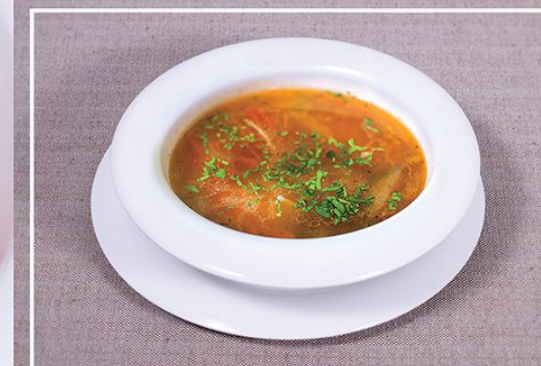
Куриный супчик с домашней лапшой 300 г. 200.00