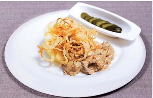
Говядина в соусе Blue Cheese с картофельным пюре и луком фри