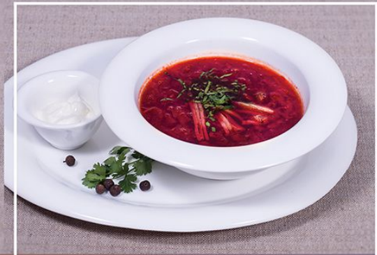
Борщ с языком и сметаной 300/30/30. 230.00