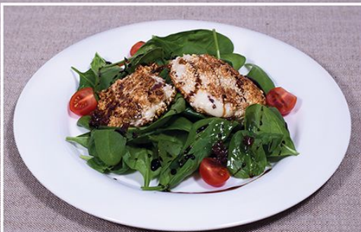
Салат из шпината с жареным сыром 410.00 (листья шпината, томаты черри, жареный сыр в кунжуте под соусом из вяленых томатов) 235 г.