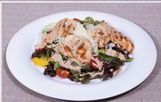
Салат с куриной грудкой 360.00 (микс-салат, куриная грудка-гриль, апельсин, томаты-черри под Греческим соусом) 170 г.