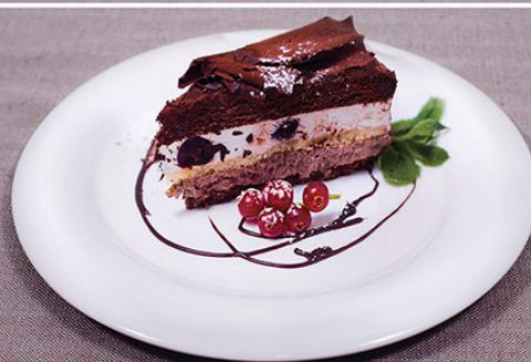
Черный лес 95 г.