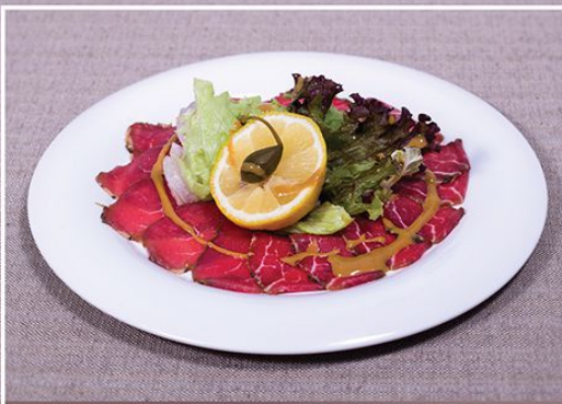
Карпаччо из телятины (телячья вырезка, Микс-салат, лимон, Европейский соус) 100/45/20