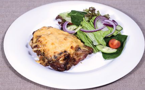
Свинина под грибным соусом