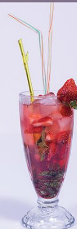
Мохито клубничный 280.00 (клубника, мята, сахар тростниковый, сироп, Спрайт, Швепс) 1/300