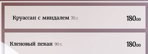
Круассан с миндалем 70 г.