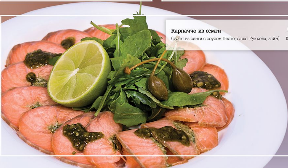
Карпаччо из семги (рулет из семги с соусом Песто, салат Руккола, лайм) 100/45/25