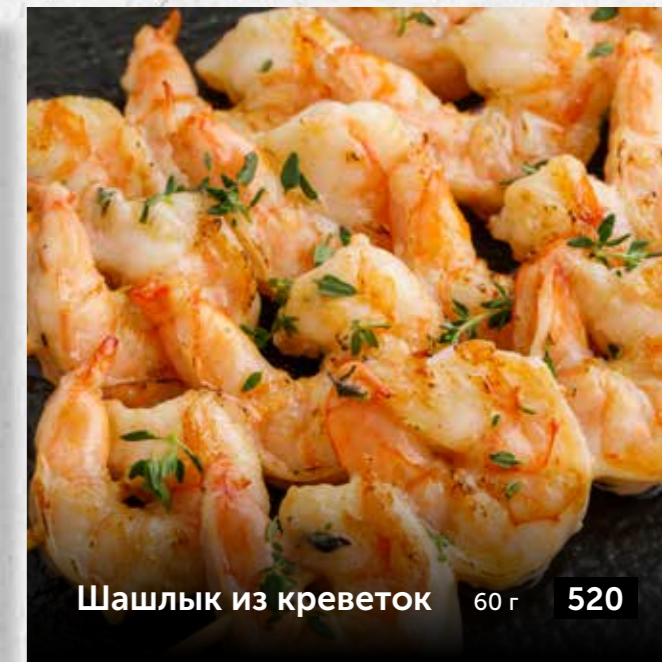
Шашлык из креветок 60 г 520