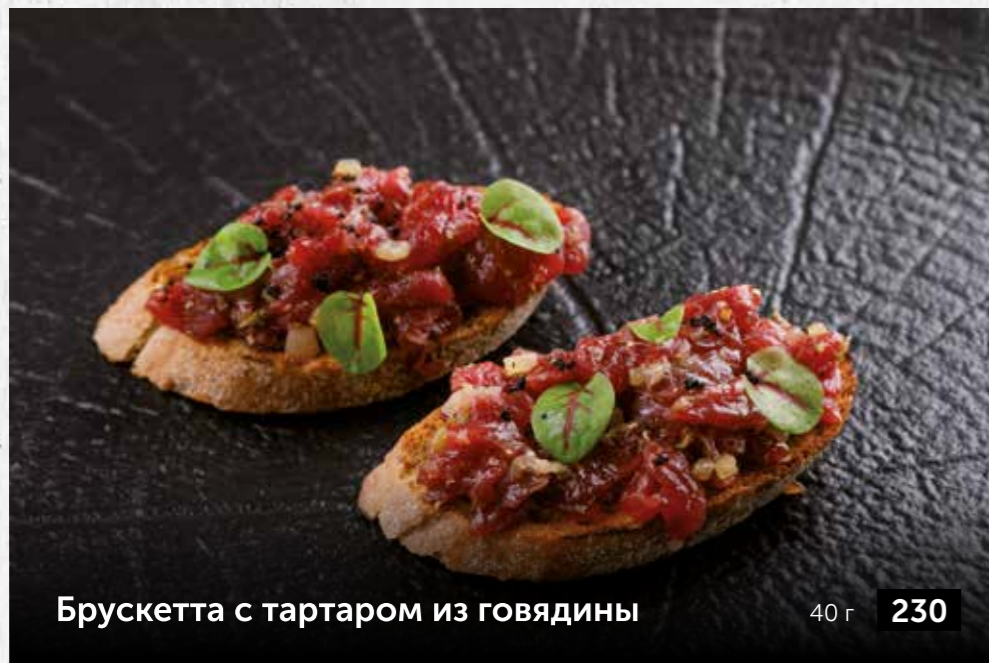
Брускетта с тартаром из говядины