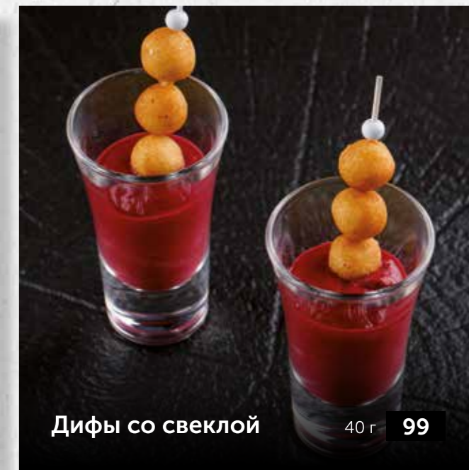
Дифы со свеклой