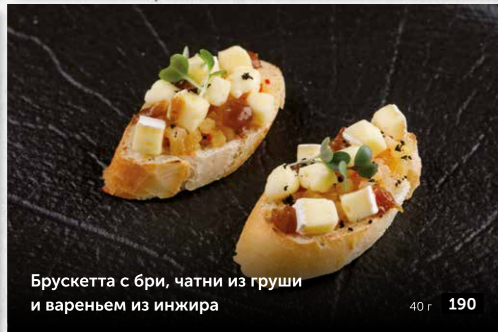
Брускетта с бри, чатни из груши и вареньем из инжира