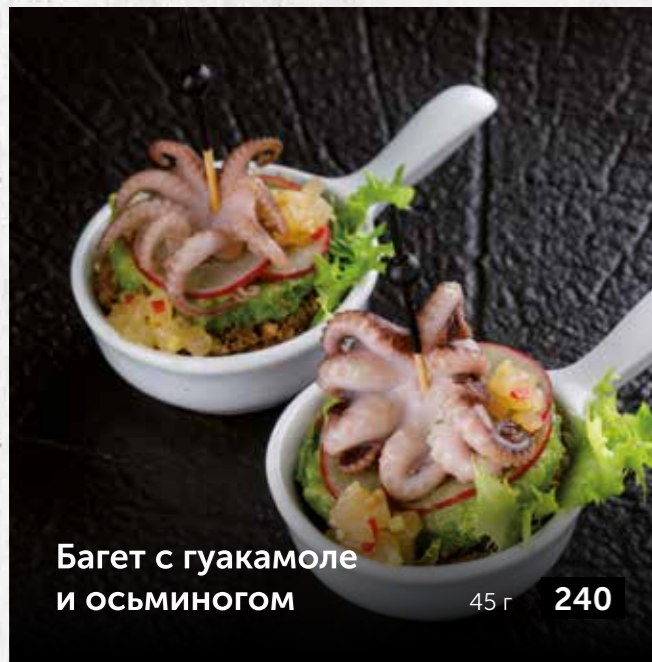
Багет с гуакамоле и осьминогом 45 г 240