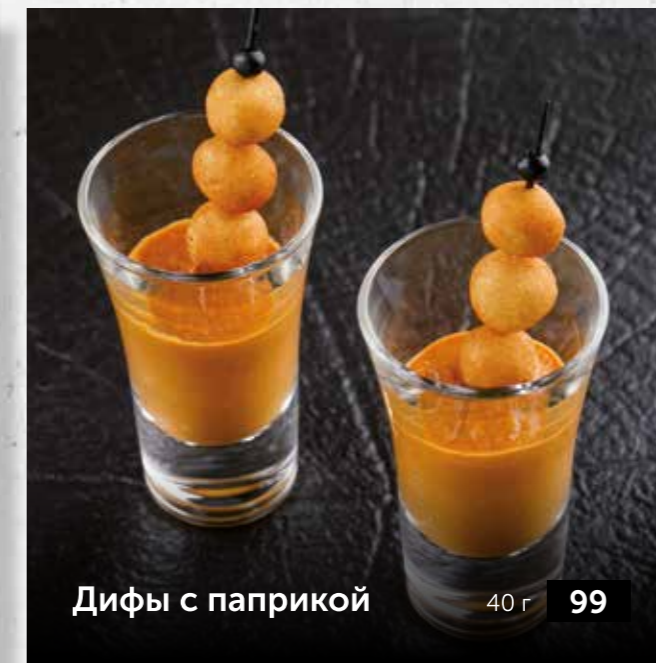
Дифы с паприкой