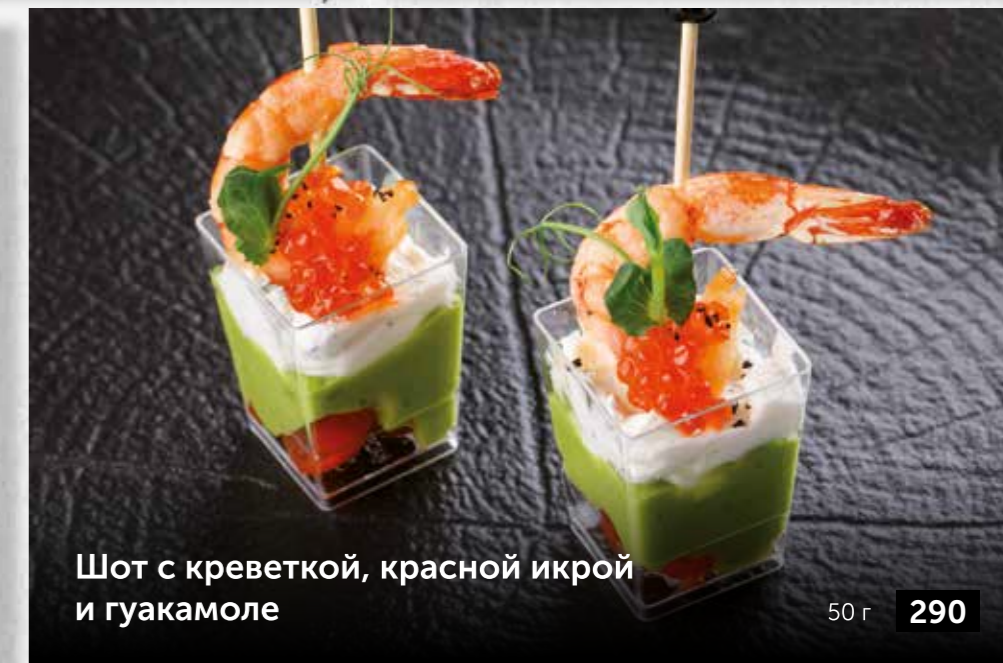
Шот с креветкой, красной икрой и гуакамоле