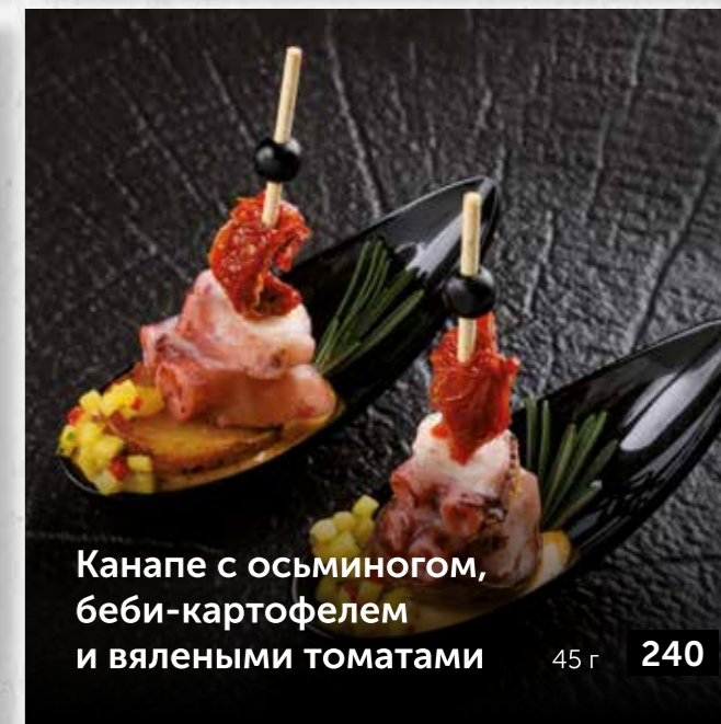
Канapé с осьминогом, беби-картофелем и вялеными томатами 45 г 240