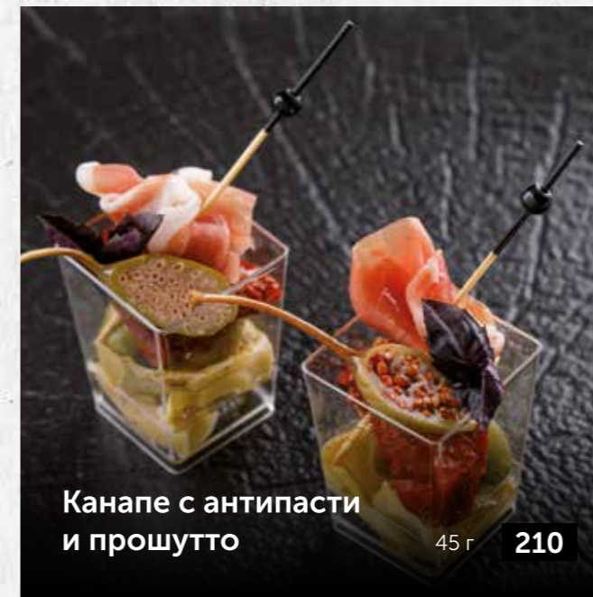
Канapé с антипасты и прошутто 45 г 210