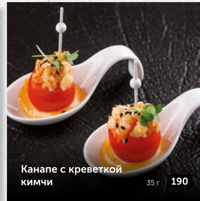
Канapé с креветкой кимчи 35 г 190