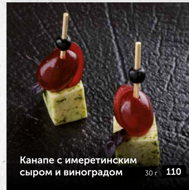
Канapé с имеретинским сыром и виноградом 30 г 110