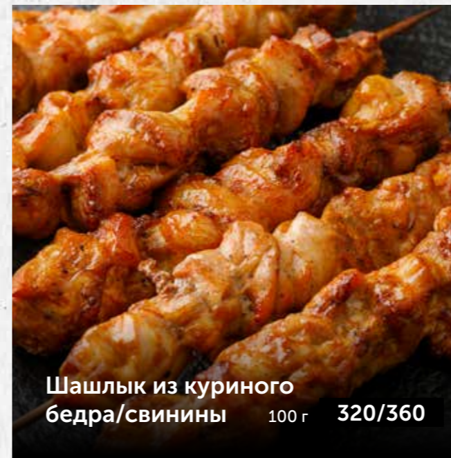
Шашлык из куриного бедра/свинины 100 г 320/360