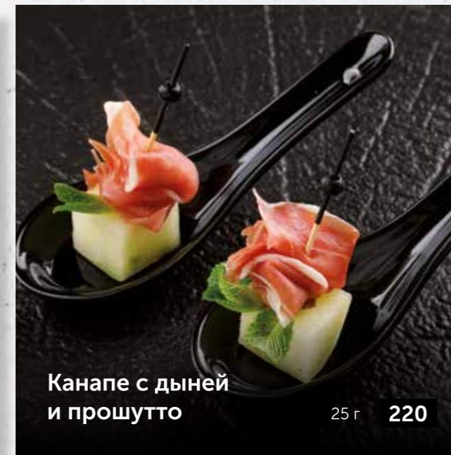
Канapé с дыней и прошутто 25 г 220