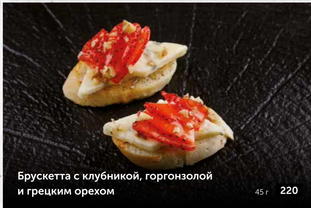
Брускетта с клубникой, горгонзолы и грецким орехом