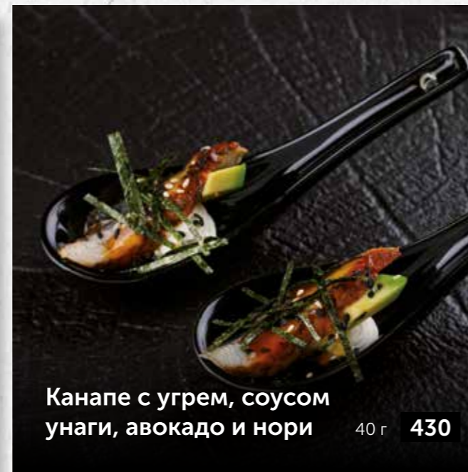
Канapé с угрем, соусом унаги, авокадо и нори 40 г 430