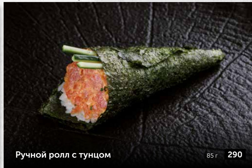
Ручной ролл с тунцом