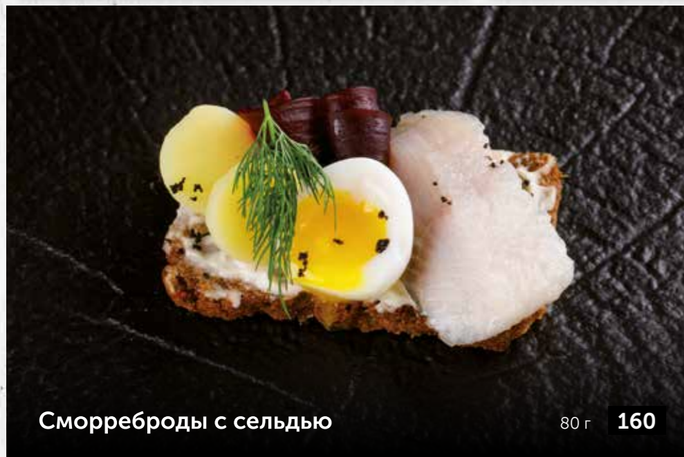
Сморреброды с сельдью 80 г 160