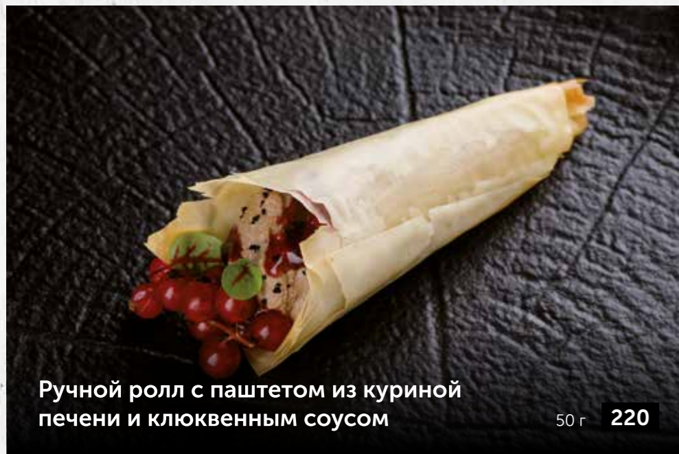
Ручной ролл с паштетом из куриной печени и клюквенным соусом