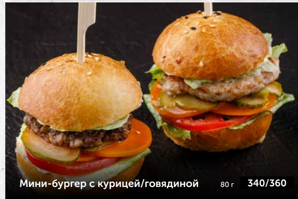
Мини-бургер с курицей/говядиной 80 г 340/360