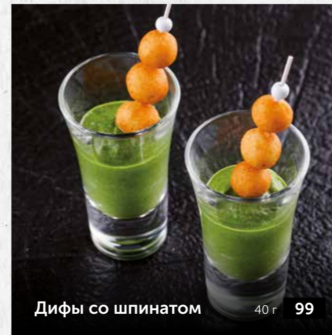
Дифы со шпинатом