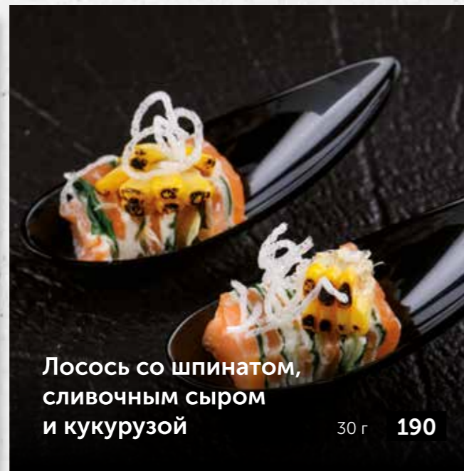
Лосось со шпинатом, сливочным сыром и кукурузой 30 г 190