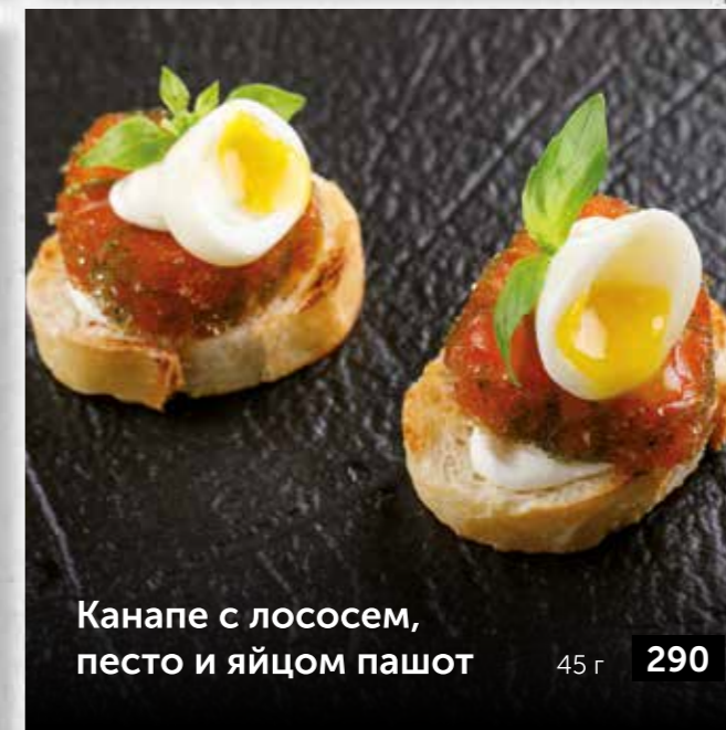
Канapé с лососем, песто и яйцом пашот 45 г 290