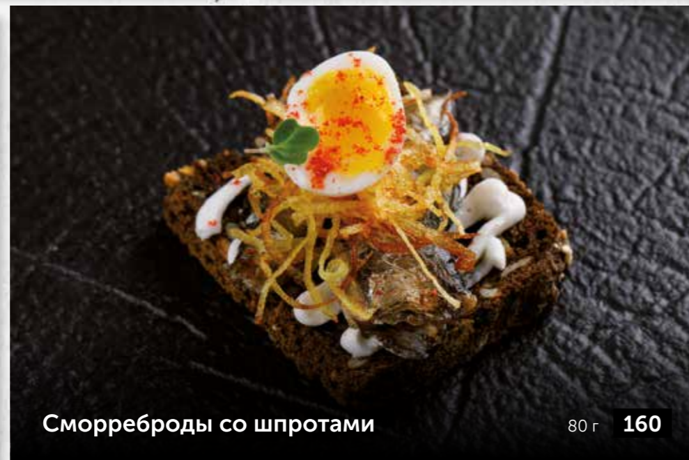
Сморреброды со шпротами 80 г 160