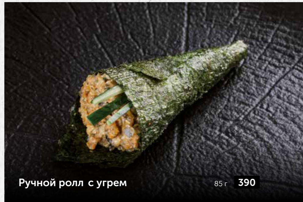
Ручной ролл с угрем