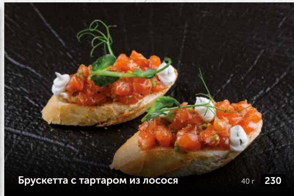
Брускетта с тартаром из лосося