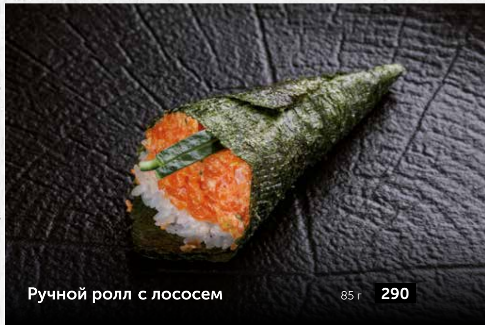
Ручной ролл с лососем